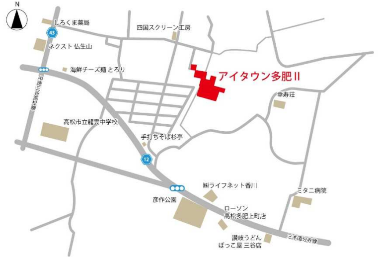
カーナビ検索：高松市多肥上町1806-7(四国スクリーン工房様)